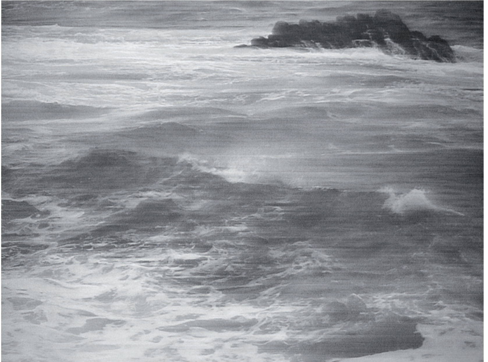
10687 Meeresansicht (Taiwan 2013), Bleistiftzeichnung auf Büttenpapier, 104 x 140 cm (124 x 157 cm), 2018