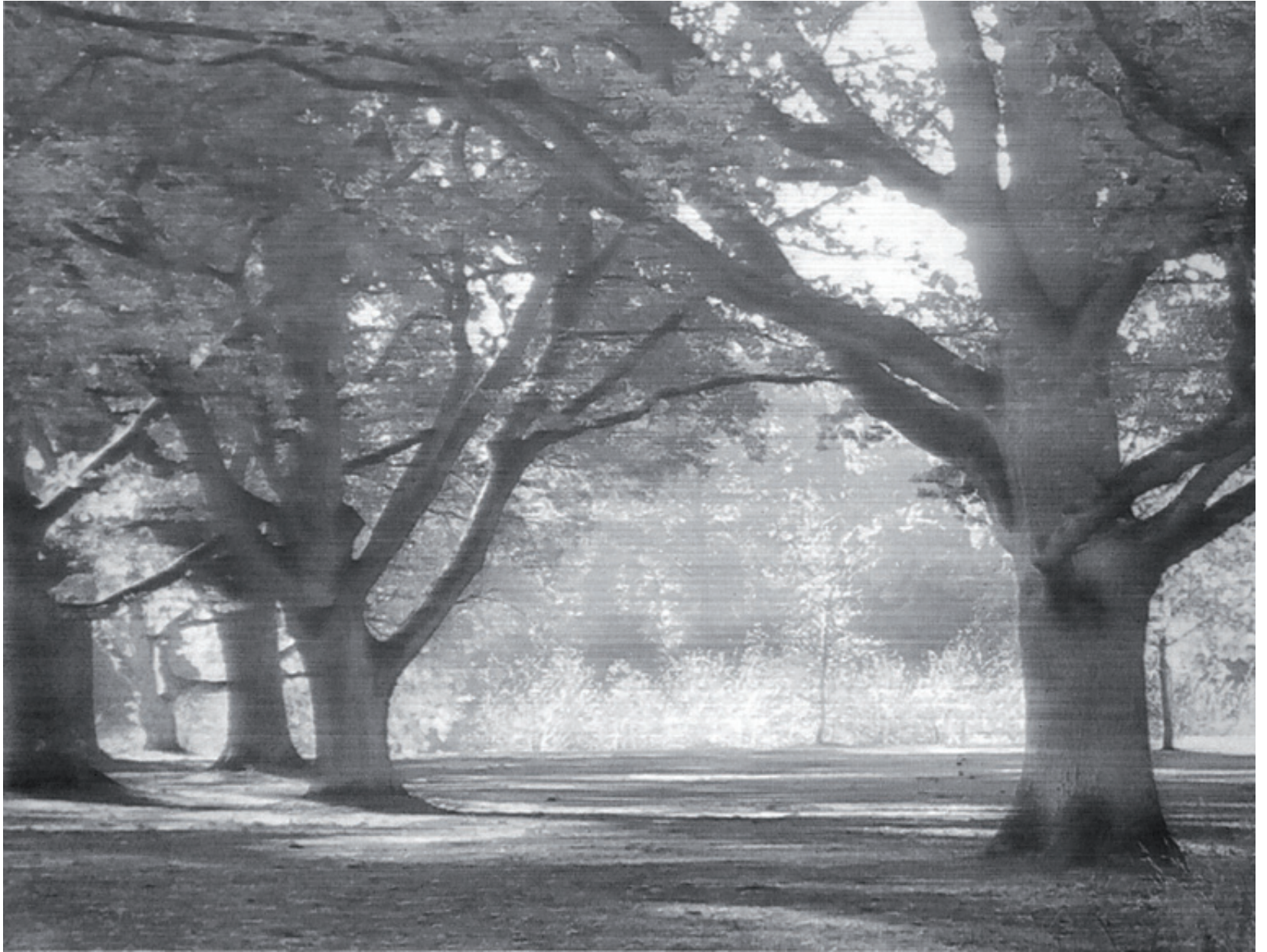
10705 Parklandschaft (Osterholzer Friedhof I), Bleistiftzeichnung auf Büttenpapier, 105 x 140 cm (124 x 157 cm), 2019