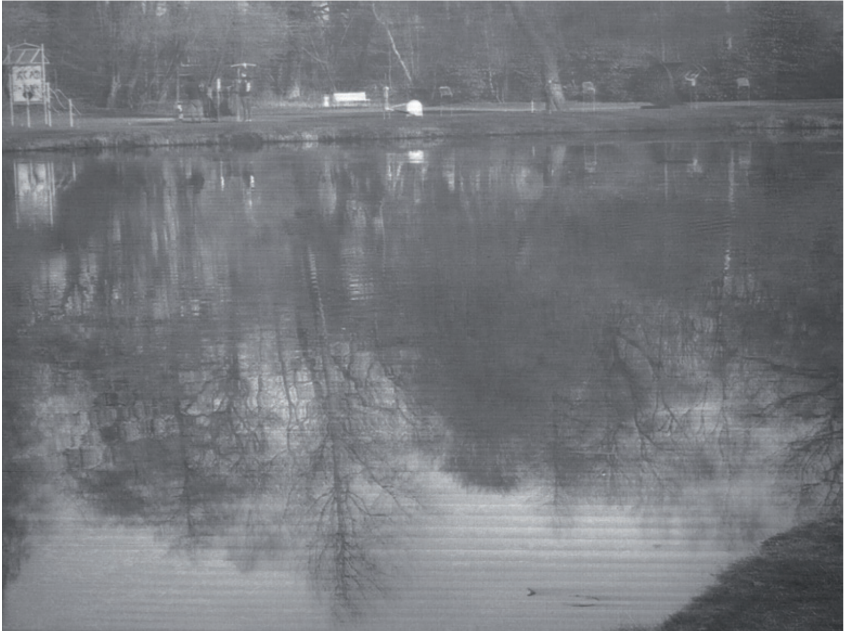
10719 Park in Friesoythe, Bleistiftzeichnung auf Büttenpapier, 109 x 140 cm (124 x 157 cm), 2019