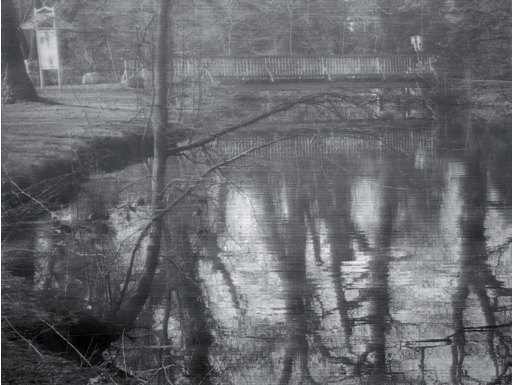
10718 Park in Friesoythe, Bleistiftzeichnung auf Büttenpapier, 109 x 140 cm (124 x 157 cm), 2019