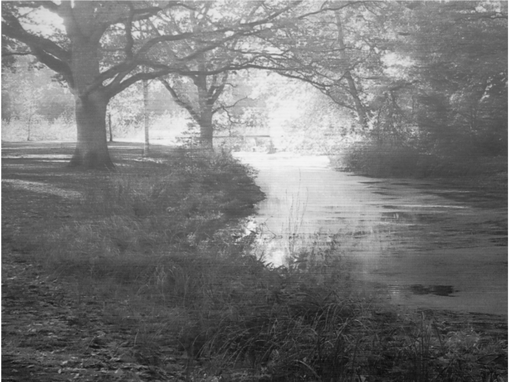
10704 Parklandschaft (Osterholzer Friedhof II), Bleistiftzeichnung auf Büttenpapier, 104,7 x 140 cm (124 x 157 cm), 2019