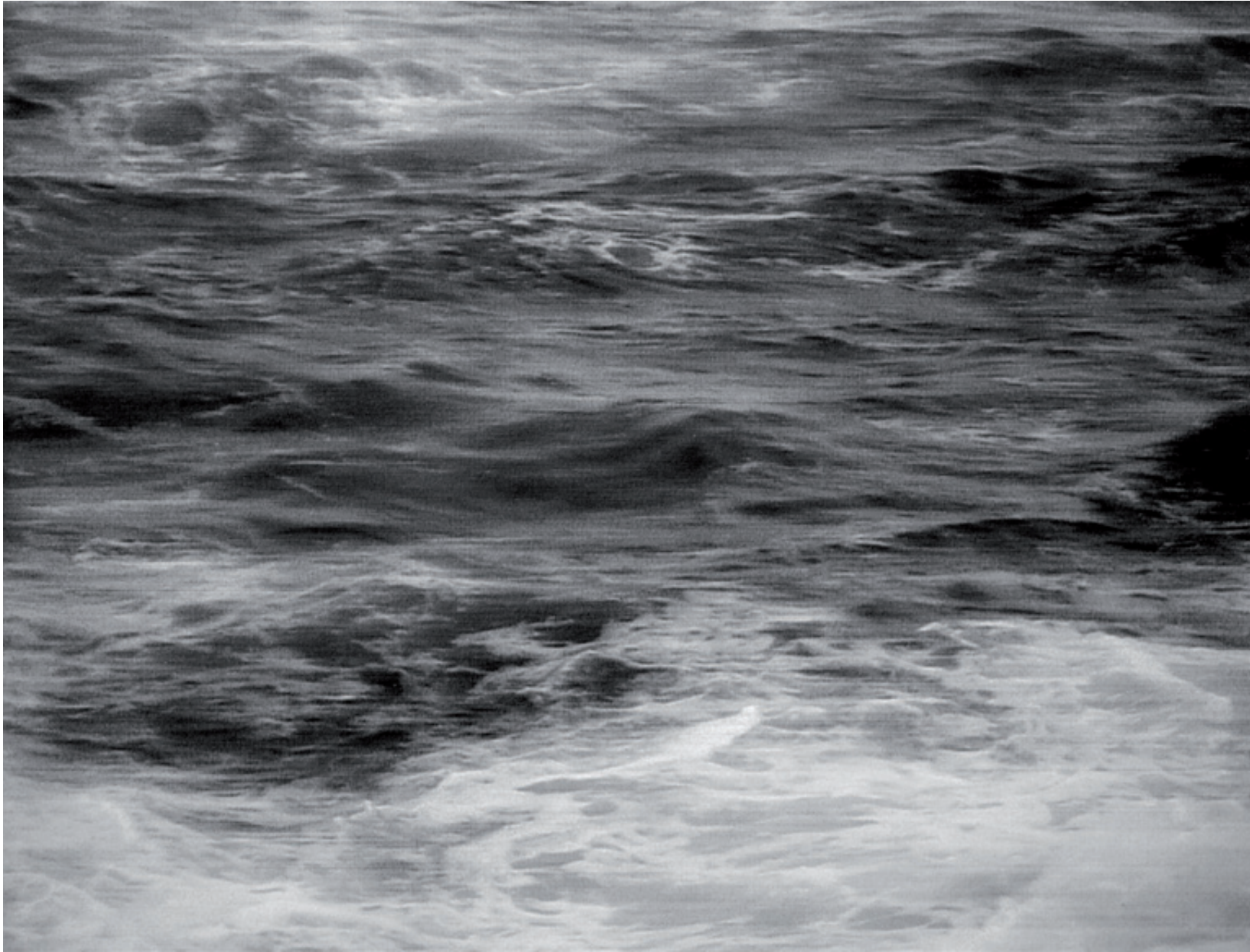
10678 Pazifischer Ozean (Taiwan 2013) Bleistiftzeichnung auf Büttenpapier, 106,5 x 140 cm (124 x 157 cm), 2018