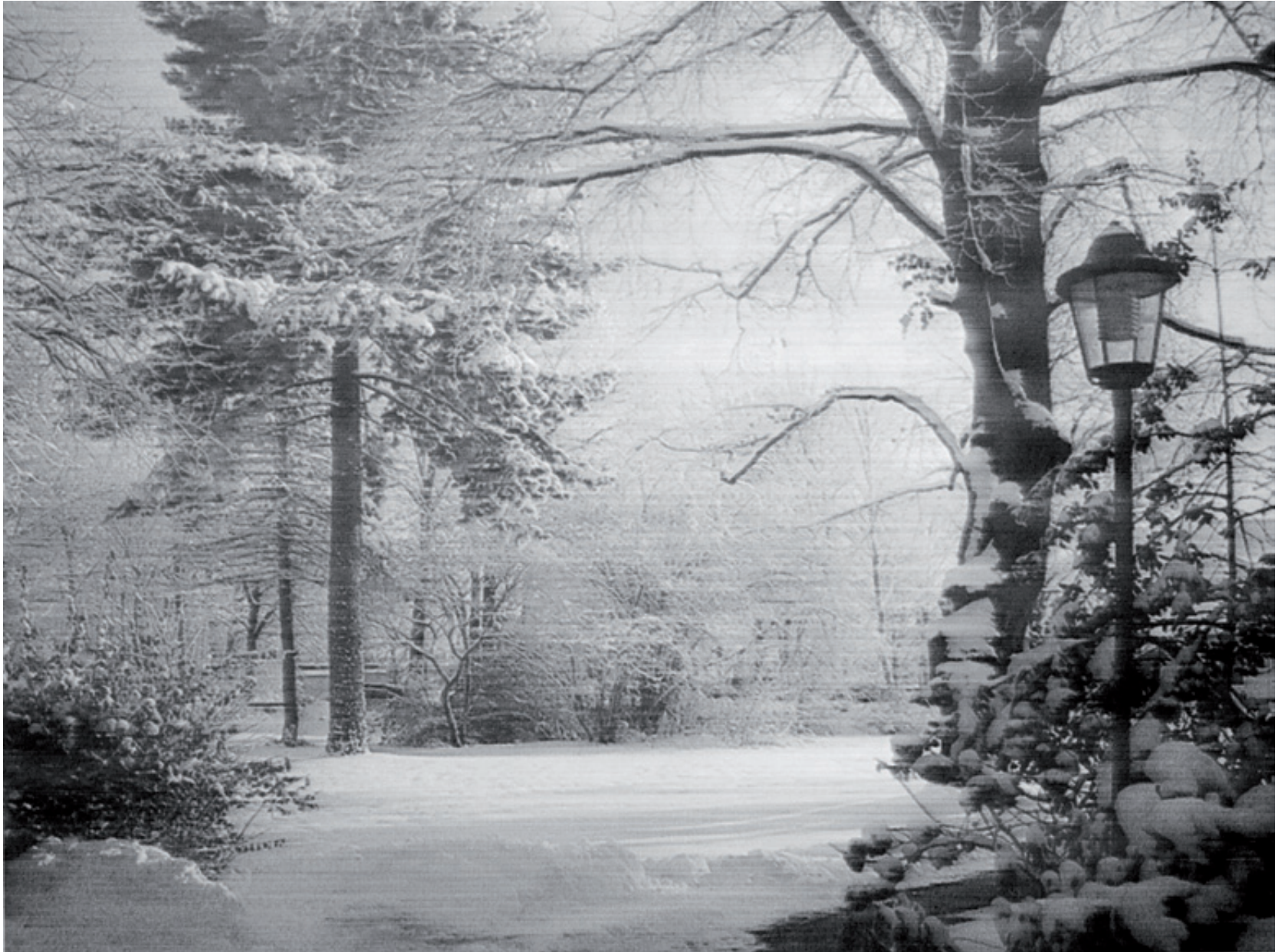
10705 Park in Diepholz, Bleistiftzeichnung auf Büttenpapier, 104,6 x 140 cm (124 x 157 cm), 2018