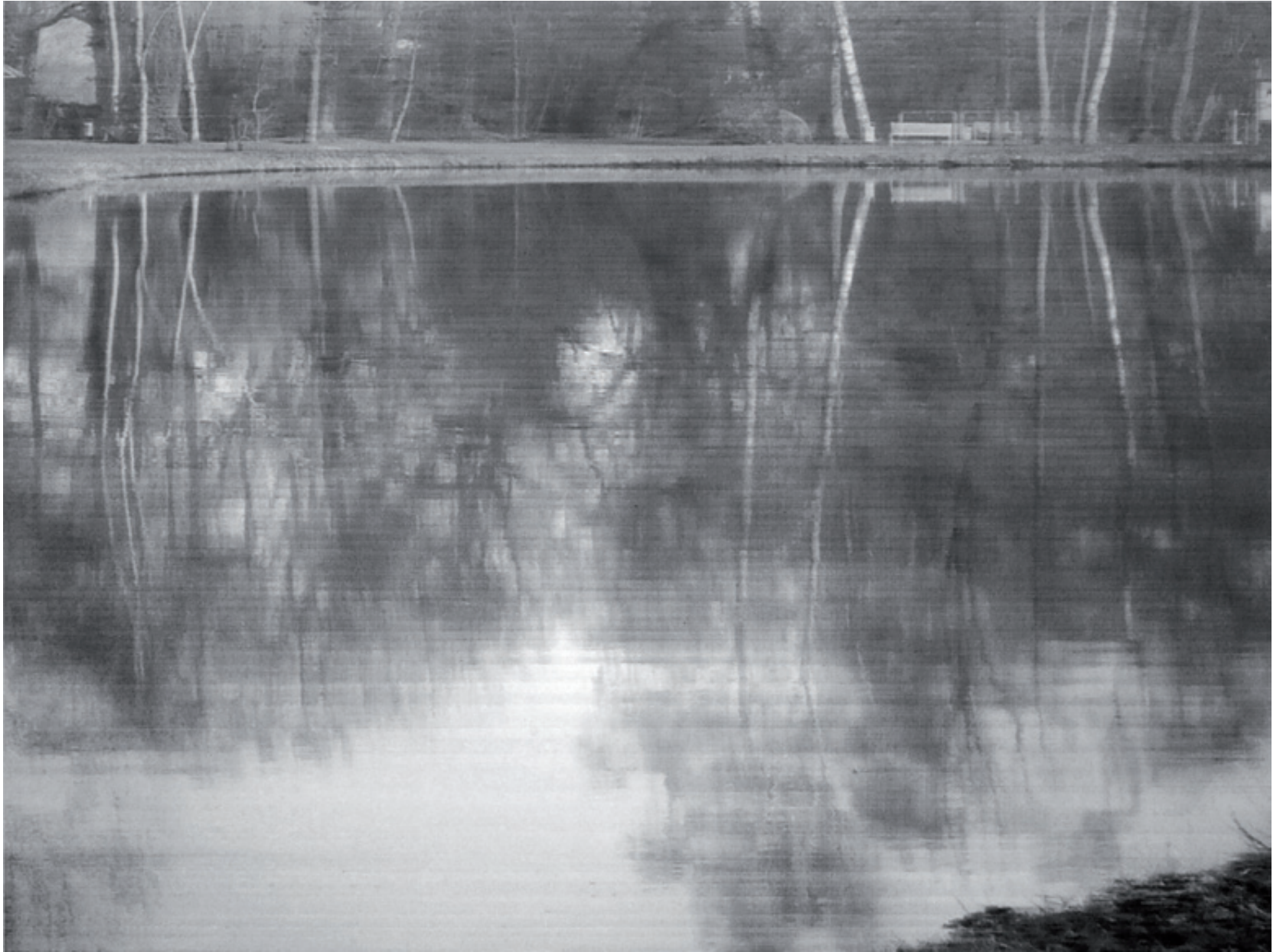
10715 Park in Friesoythe, Bleistiftzeichnung auf Büttenpapier, 109 x 140 cm (124 x 157 cm), 2019