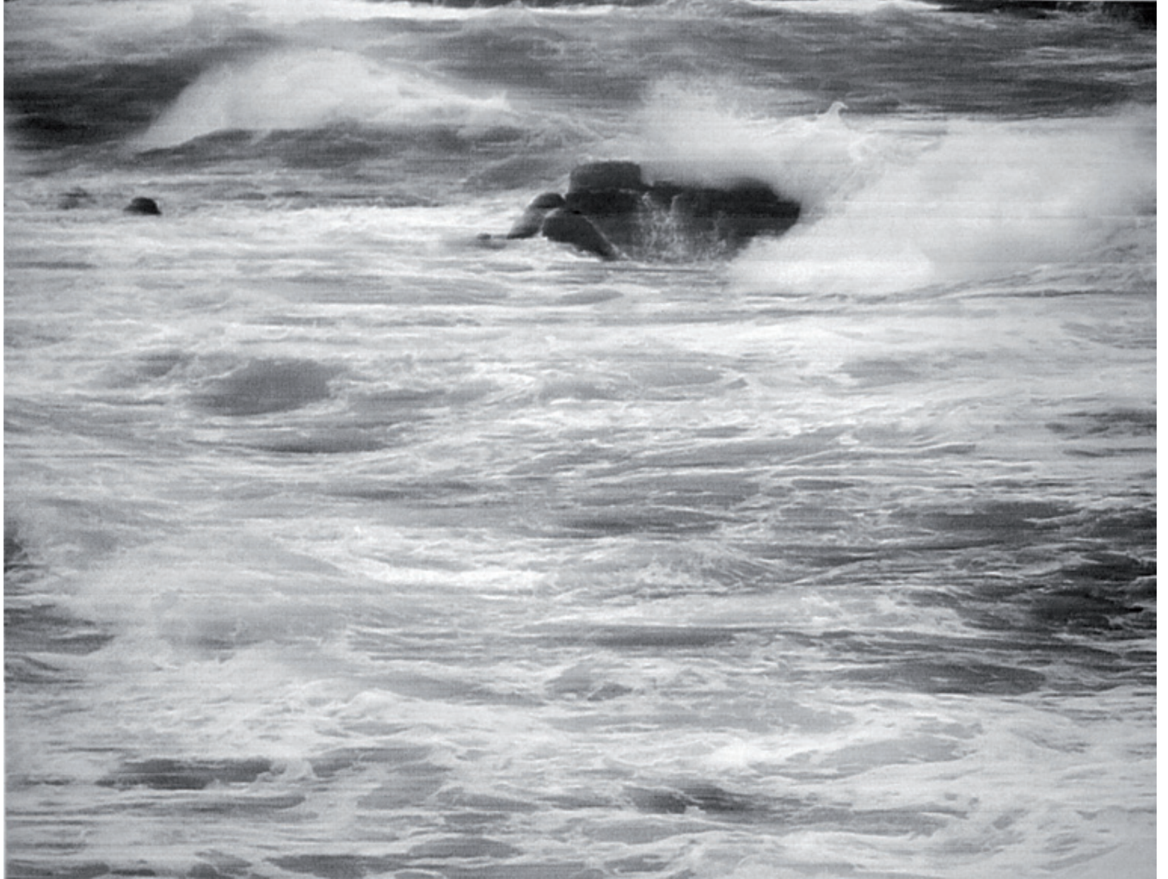
10679 Brandung (Taiwan 2013), Bleistiftzeichnung auf Büttenpapier, 106,2 x 140 cm (124 x 157 cm), 2018