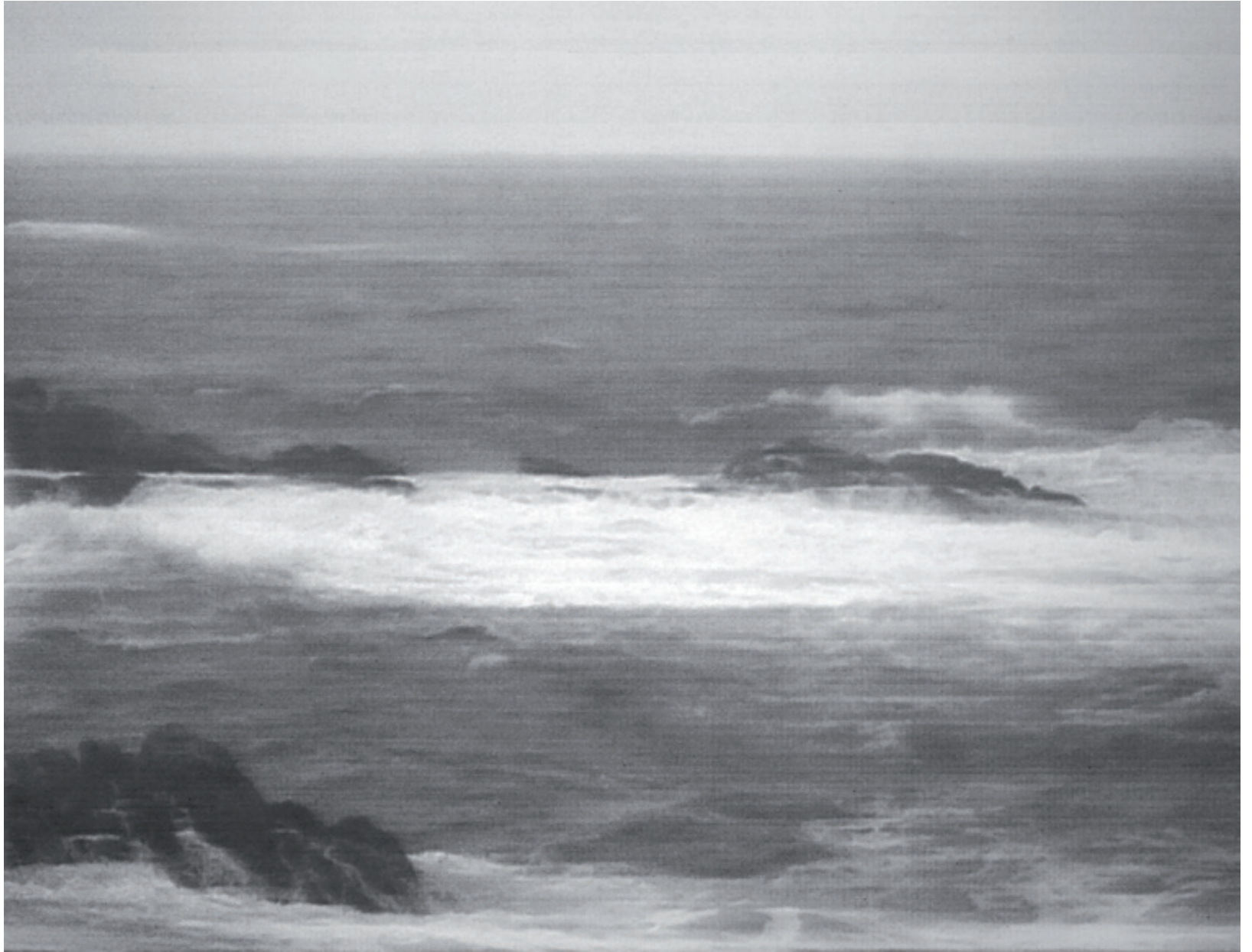
10716 Meer bei Binhai Gonglu (Taiwan 2013), Bleistiftzeichnung auf Büttenpapier, 83 x 109 cm (102 x 124 cm), 2019,